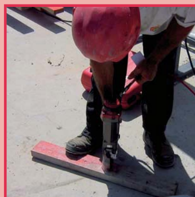
Verbindung Holz und Beton