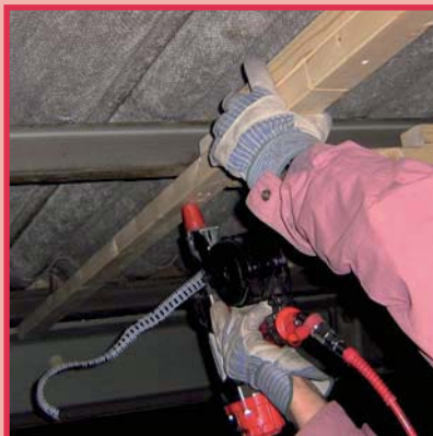
Verbindung Holz und Stahl