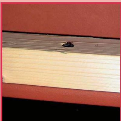
Verbindung Holz und Stahl