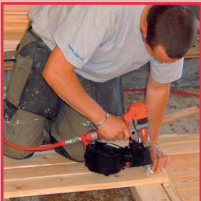
Verbindung Holz und Holz