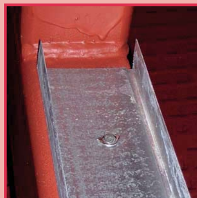
Verbindung C-Profil und Stahl