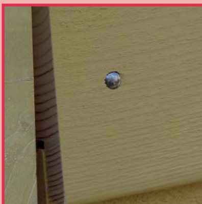
Linienkopfnagel Holz und Holz