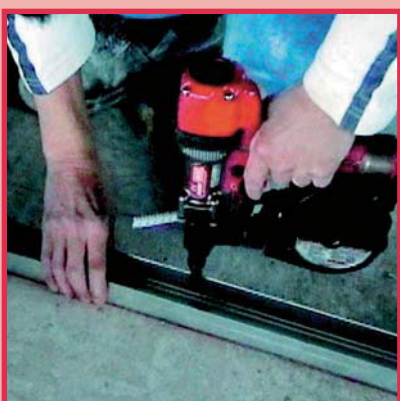
Verbindung C-Profil und Beton